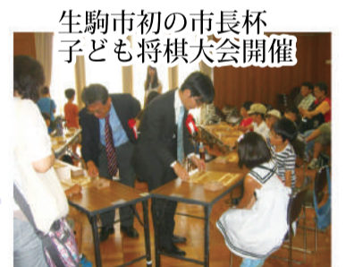
生駒市初の市長杯 子ども将棋大会開催

音楽の街として全国に名を馳せている生駒市。幅広い世代の市民が音楽に親しめるよう来年から市民吹奏楽団の発足を目指しています。また市民みんなで創る音楽祭が今年から開催され10月から来年3月まで半年間、市民の企画による音楽イベントを実施します。