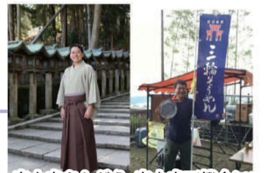
宝山寺さんどう 宝山寺万燈会にて ご緑市で和装 恒例の流し素麺

市民による市民のためのイベントづくり。 10月13日現在ですでに36のイベントを認定。